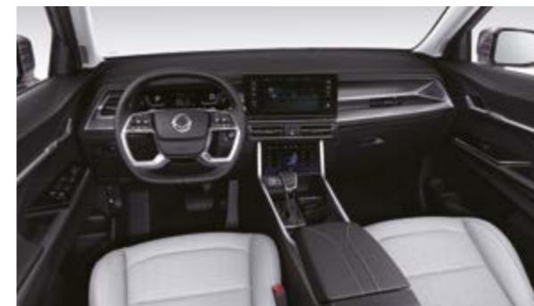
Wnętrze w kolorze jasnej szarości (ACE)