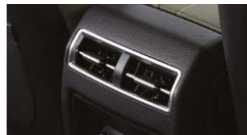
Nawiew powietrza w konsoli środkowej dla drugiego rzędu foteli