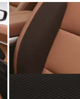
Tapicerka ze skóry ekologicznej TPU łączona z tkaniną