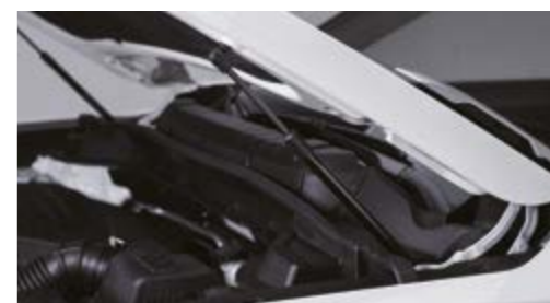
Siłowniki teleskopowe maski