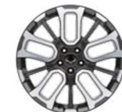
20" felgi aluminiowe