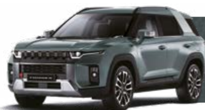
FOREST GREEN (GAO)