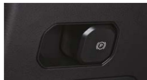
Elektryczny hamulec parkingowy z funkcją Auto-Hold