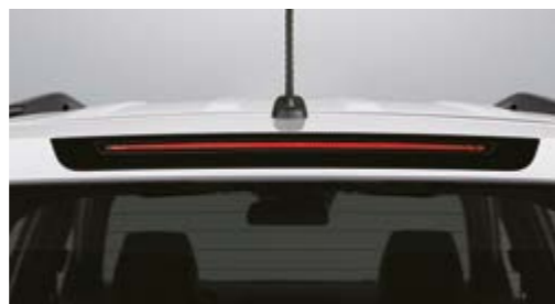
Wysoko zamontowane trzecie światło stop wykonane w technologii LED