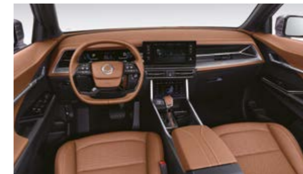
Wnętrze w kolorze brązowym (OBB)