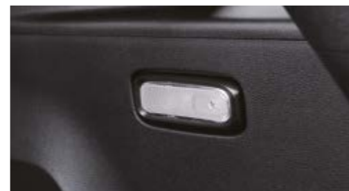
Oświetlenie przestrzeni bagażowej