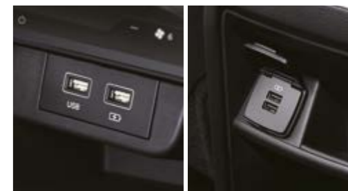
Gniazda USB - do odczytu danych i ładujące, z przodu i z tyłu