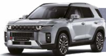
IRON METAL (ADE)