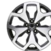
18" felgi aluminiowe