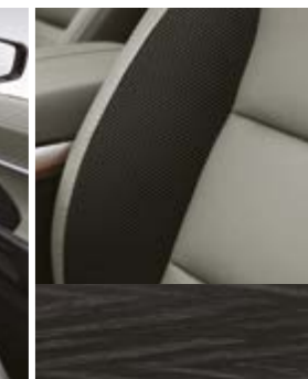
Tapicerka ze skóry ekologicznej TPU łączona z tkaniną