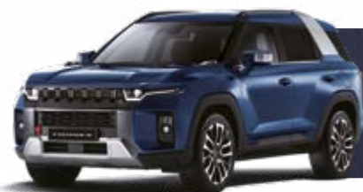
DANDY BLUE (BAS)