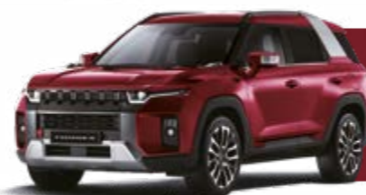
CHERRY RED* (RAV)