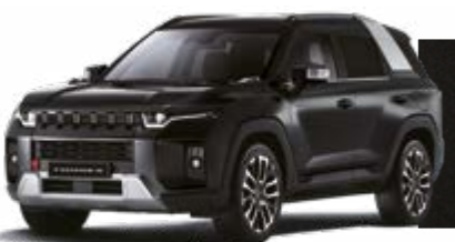
SPACE BLACK (LAK)