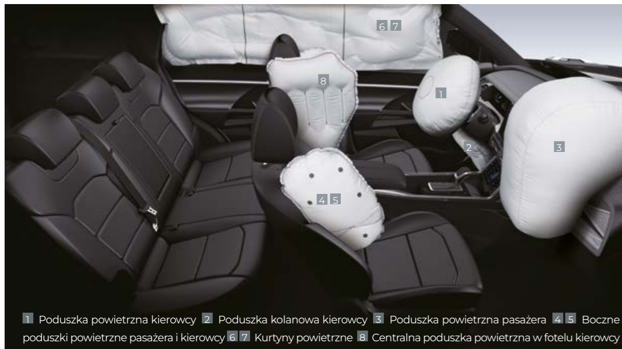
1 Poduszka powietrzna kierowcy 2 Poduszka kolanowa kierowcy 3 Poduszka powietrzna pasażera 4 5 Boczne poduszki powietrzne pasażera i kierowcy 6 7 Kurtyny powietrzne 8 Centralna poduszka powietrzna w fotelu kierowcy