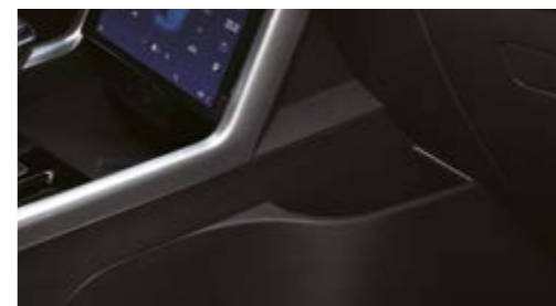
Schówek w przedniej konsoli