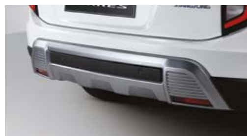
Tyłne osłony podwozia stylizowane na metal