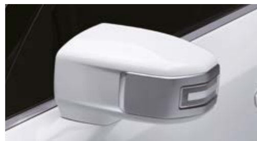
Lusterka zewnętrzne w kształcie flagi z kierunkowskazami