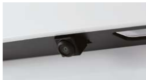
Kamera cofania HD