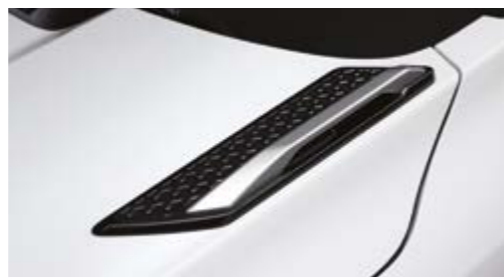
Uchwyty na masce