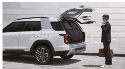
Elektrycznie sterowana kłapa bagażnika