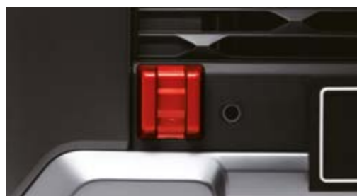
Oslona montażowa haka holowniczego