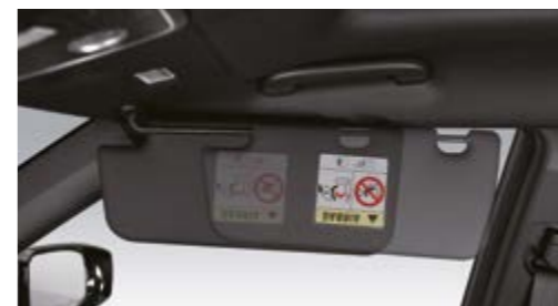
Oslona przeciwsłoneczna z oświetleniem i możliwością wydłużenia