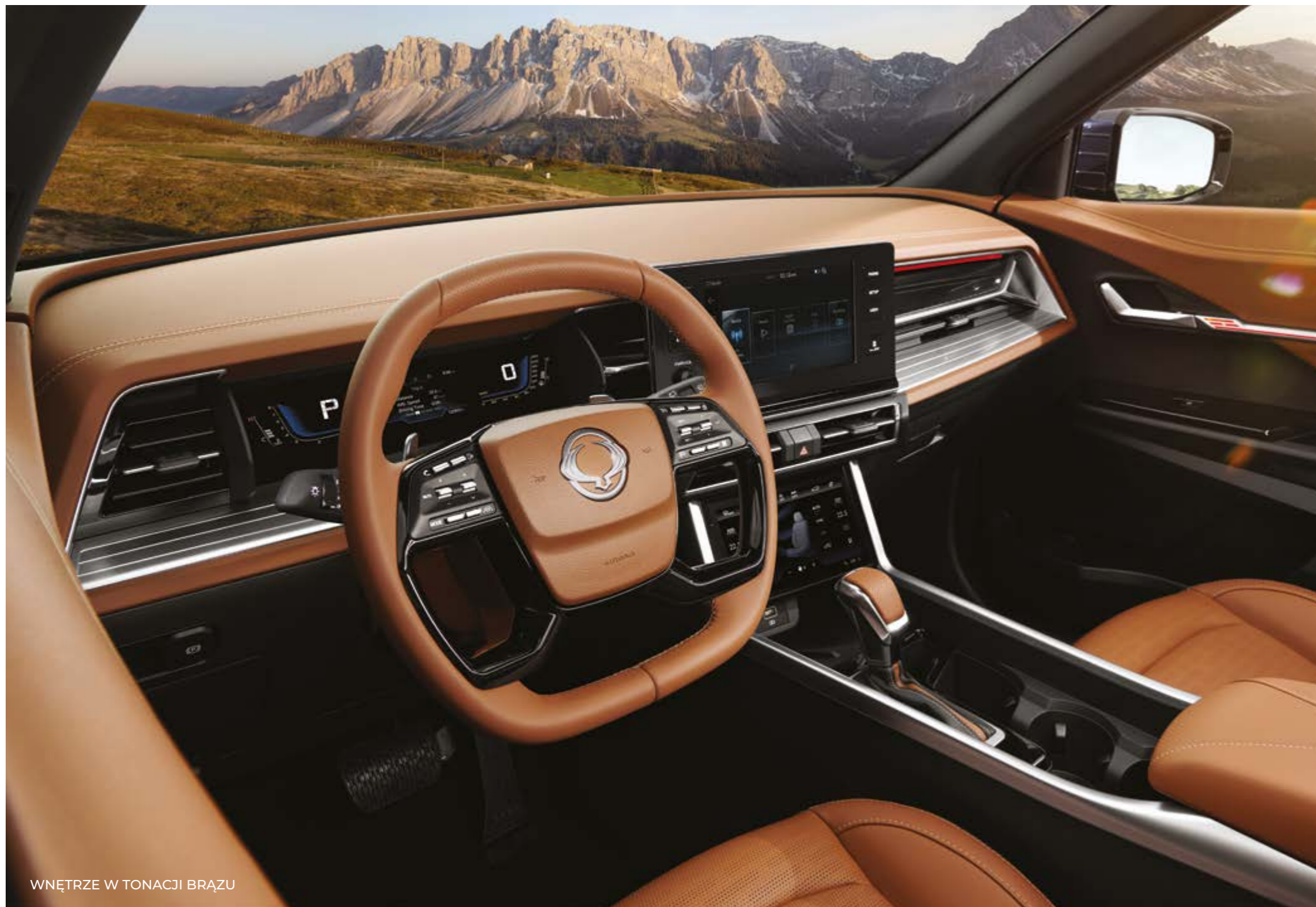
WNĘTRZE W TONACJI BRĄZU