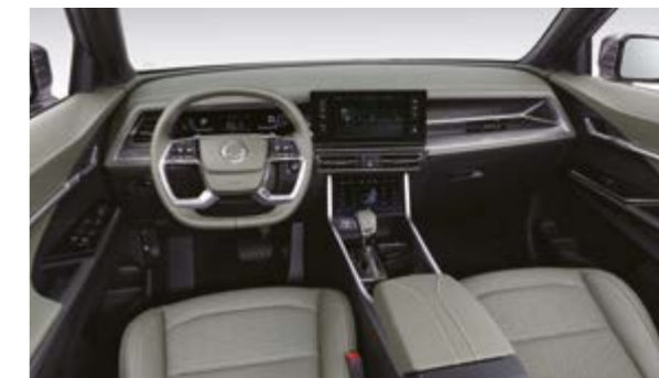
Wnętrze w kolorze khaki (GAN)