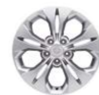
17" felgi aluminiowe