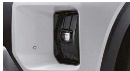
Przednie światła przeciwmgłowe LED