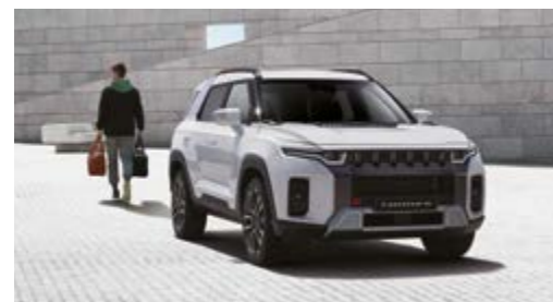
Funkcja automatycznego zamykania

PRZYGOTUJ SIĘ NA KAŻDĄ EWENTUALNOŚĆ — ZRÓB TO W DOBRYM STYLU