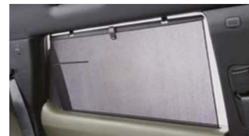
Roleta przeciwsłoneczna w oknach tylnych drzwi