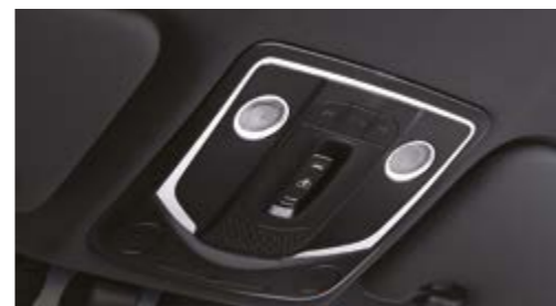
Konsola w podsufitce z oświetleniem punktowym

WYBIERZ INTELIGENTNE, UŁATWIAJĄCE ŻYCIE, KOMFORTOWE ROZWIĄZANIA