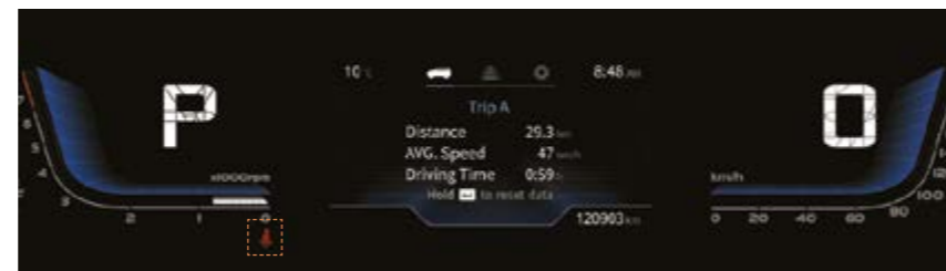
KONTROLKI NIEZAPIĘTYCH PASÓW BEZPIECZEŃSTWA DLA WSZYSTKICH PIĘCIU MIEJSC SIEDZĄCYCH