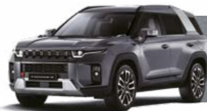
PLATINUM GREY (ADA)