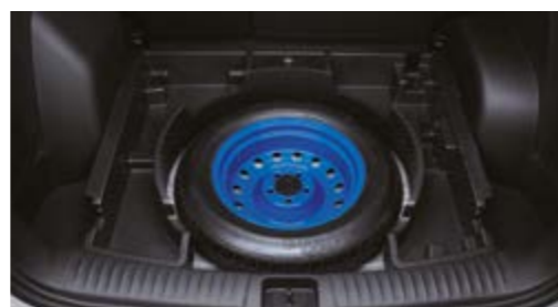
Koło zapasowe dojazdowe (dla napędu AWD)