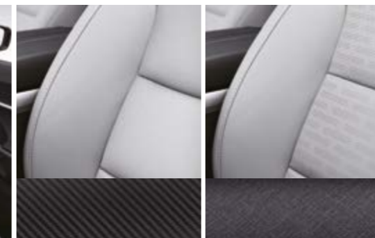
Tapicerka ze skóry ekologicznej TPU łączona z tkaniną (wersja Adventure) Tapicerka skórzana (wersja Wild)