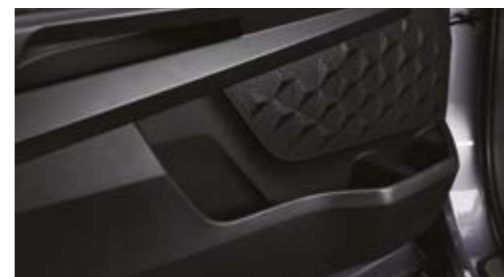
Kieszenie w drzwiach