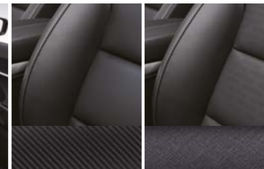
Tapicerka ze skóry ekologicznej TPU łączona z tkaniną (wersja Adventure) Tapicerka skórzana (wersja Wild)