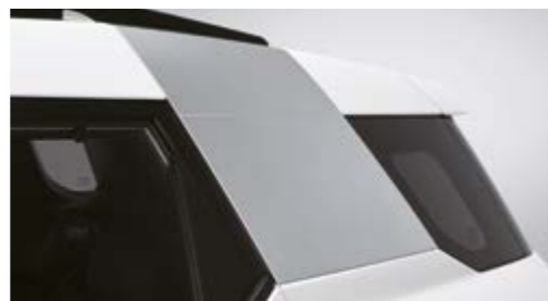
Tyłny słupek nadwozia stylizowany na metal

WYBIERZ INTELIGENTNE, UŁATWIAJĄCE ŻYCIE, KOMFORTOWE ROZWIĄZANIA